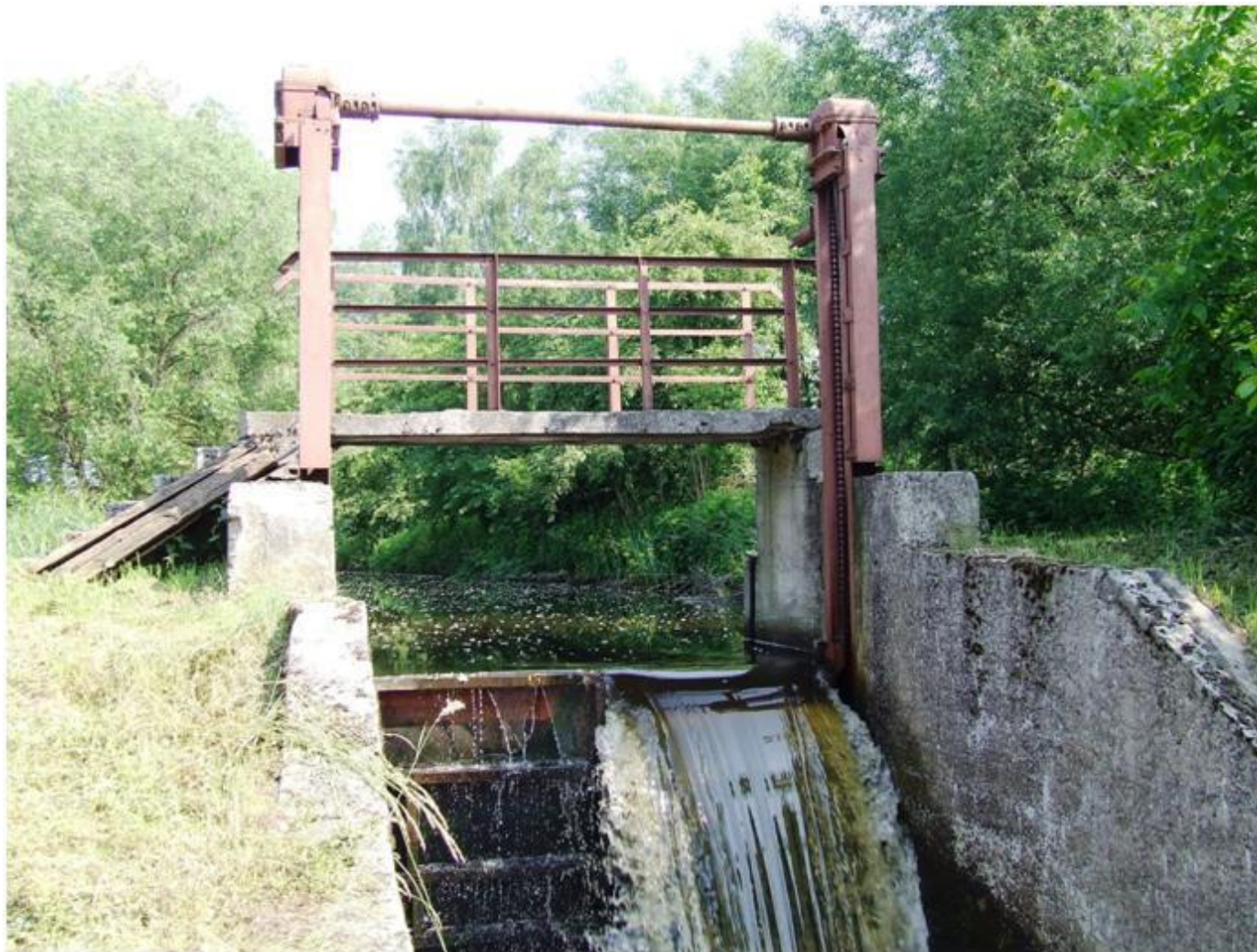
Widok na śluzę od strony wschodniej