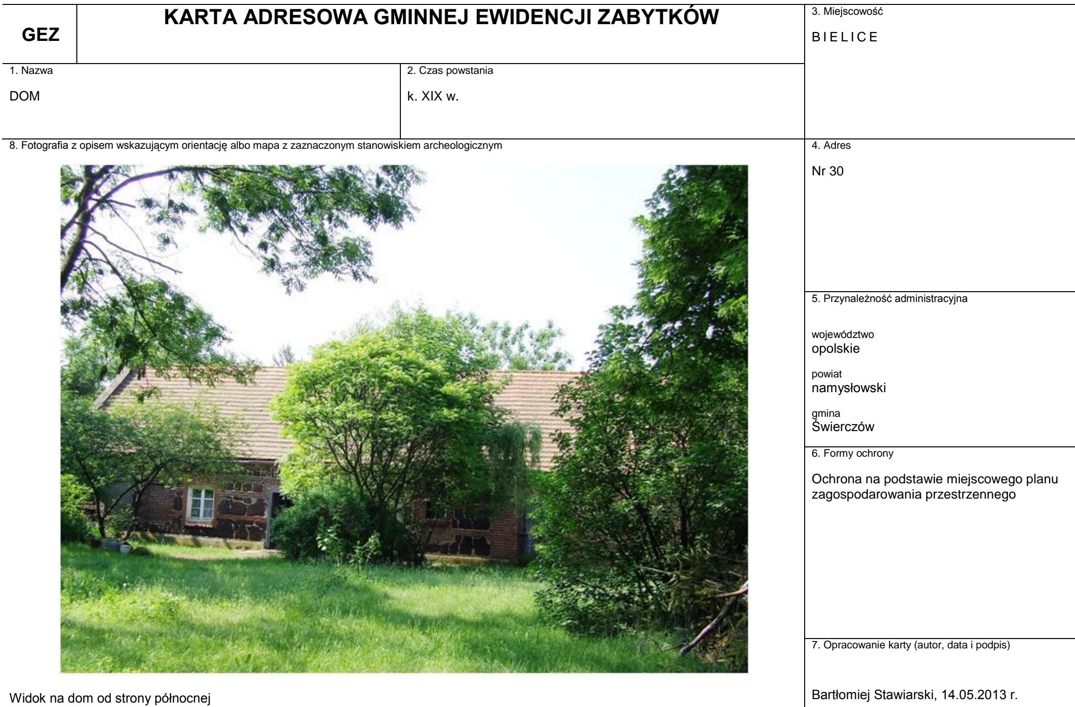
Widok na dom od strony północnej