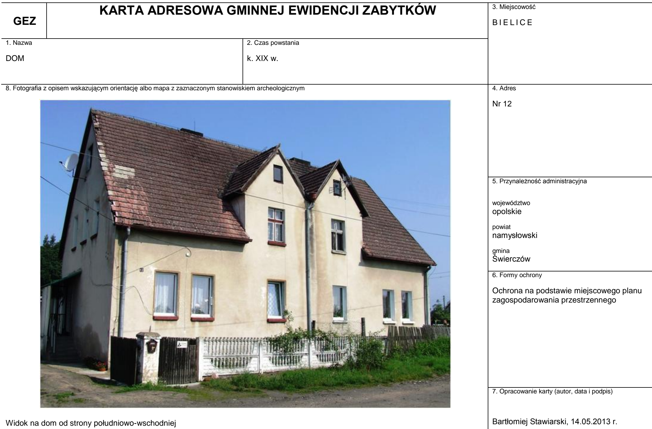
Widok na dom od strony południowo-wschodniej