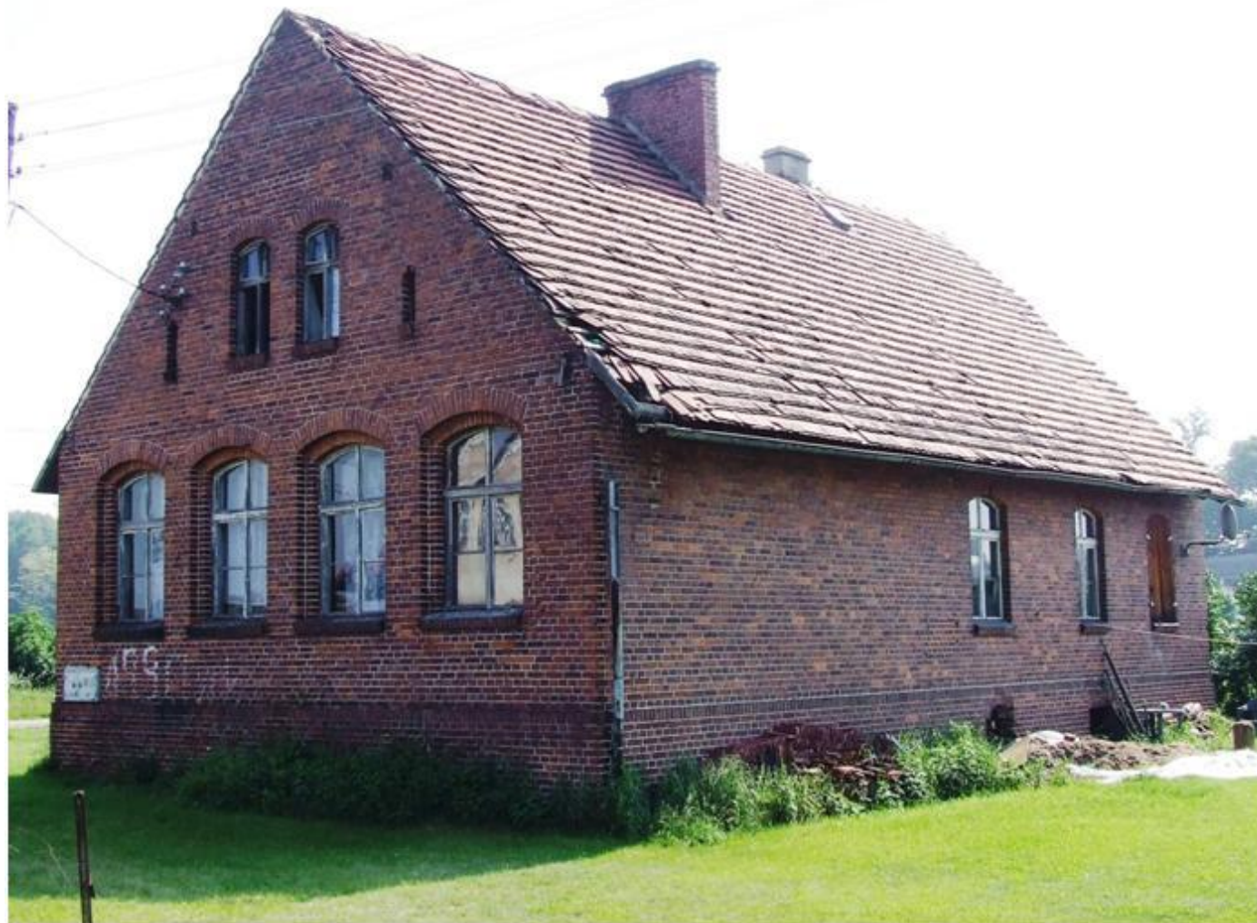
Widok na świetlicę od strony południowo-zachodniej

8. Fotografia z opisem wskazującym orientację albo mapa z zaznaczonym stanowiskiem archeologicznym