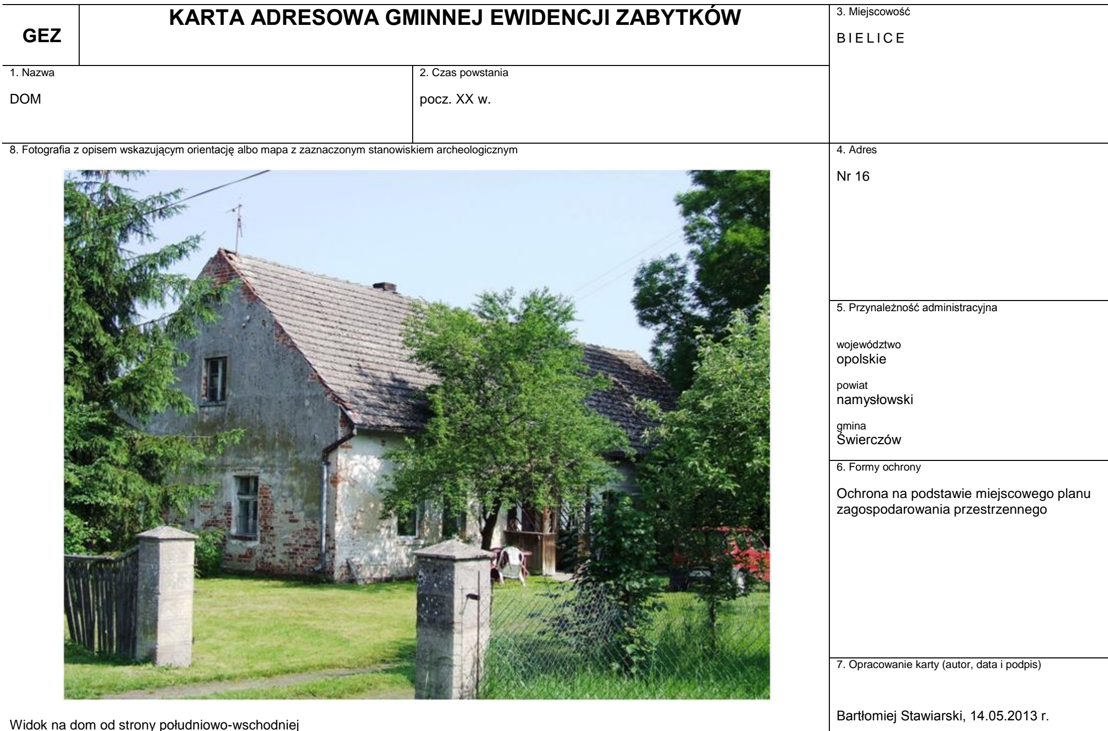
Widok na dom od strony południowo-wschodniej