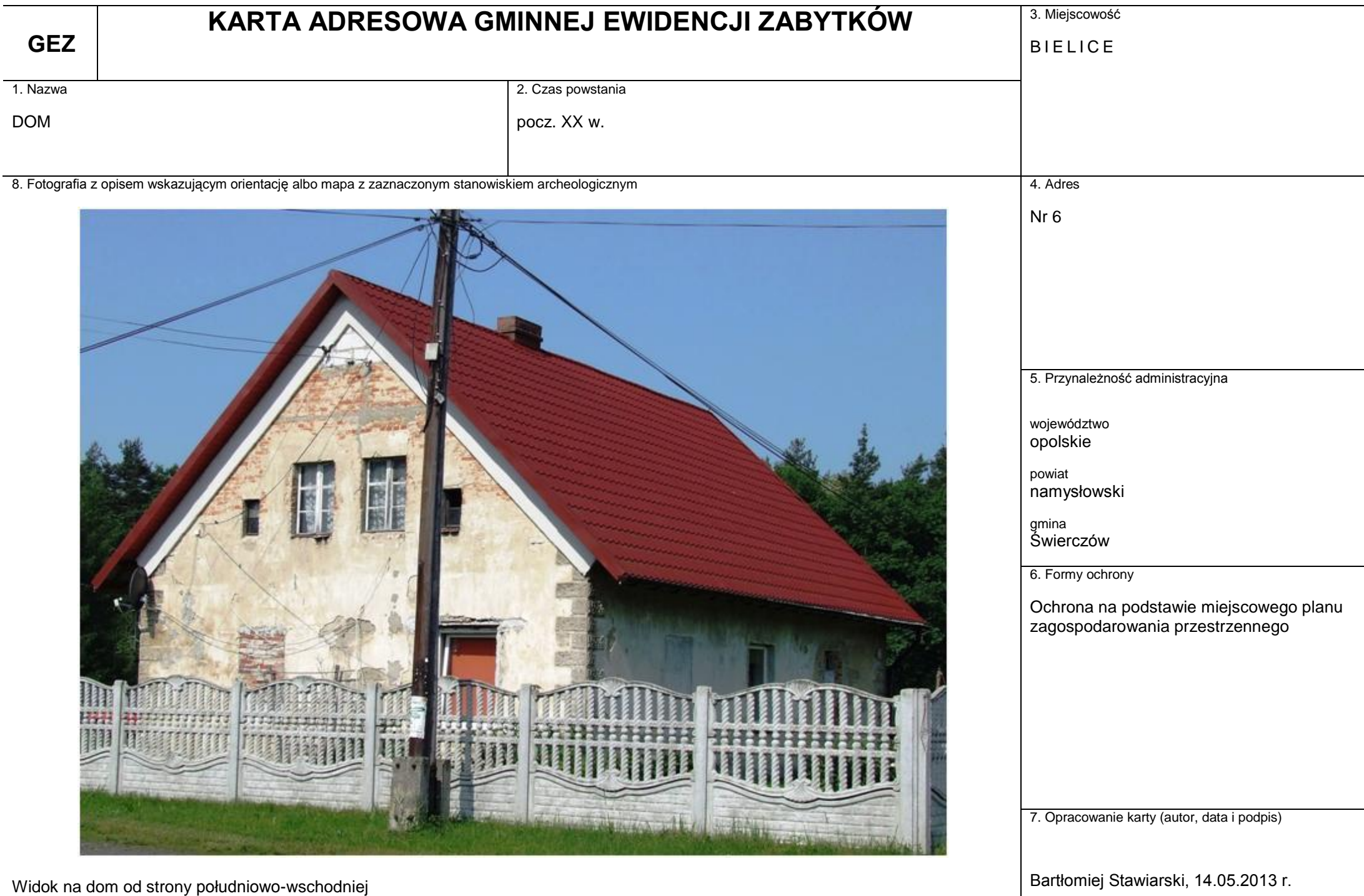
Widok na dom od strony południowo-wschodniej