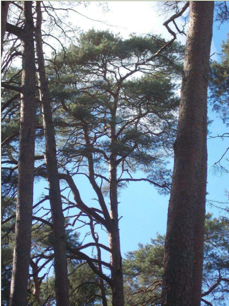
Na zdjęciu powyżej – ponad dwustuletni drzewostan sosnowy w Rezerwacie Blok. Fotografia dnia 29.09.2018 r.