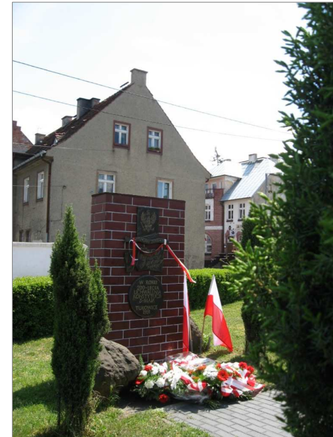
Na zdjęciu – Skwer Konstytucji 3-go Maja w Tułowicach. Tablicę pamiątkową, w roku 200-lecia Konstytucji 3 Maja, odsłonięto 11 listopada 1991 r.